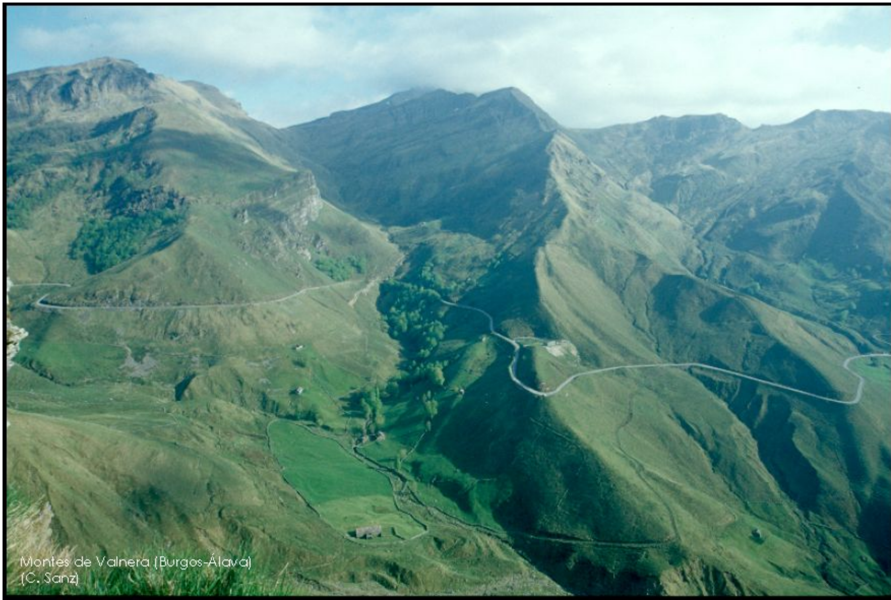
Montes de Valnera (Burgos-Álava) (C. Sanz)